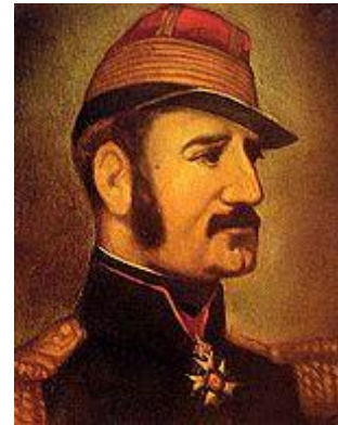
Général Marie-Alphonse BÉDEAU (1804/1863)

Le général BÉDEAU en 1846, avait signalé à la Commission du peuplement, cette plaine fertile, aux terres riches, véritable nœud de routes à destination de PHILIPPEVILLE, BÔNE, GUELMA et CONSTANTINE. Les ruines importantes qui existaient, démontraient que les Romains, bons juges en matière de colonisation, avaient dû créer, dans cette vallée de l'Oued FENDECK, une colonie florissante. Le général BÉDEAU songeait à reprendre la tradition des Légions Augustiennes et à réserver ces terrains aux vieux soldats libérés et à leurs familles de France.