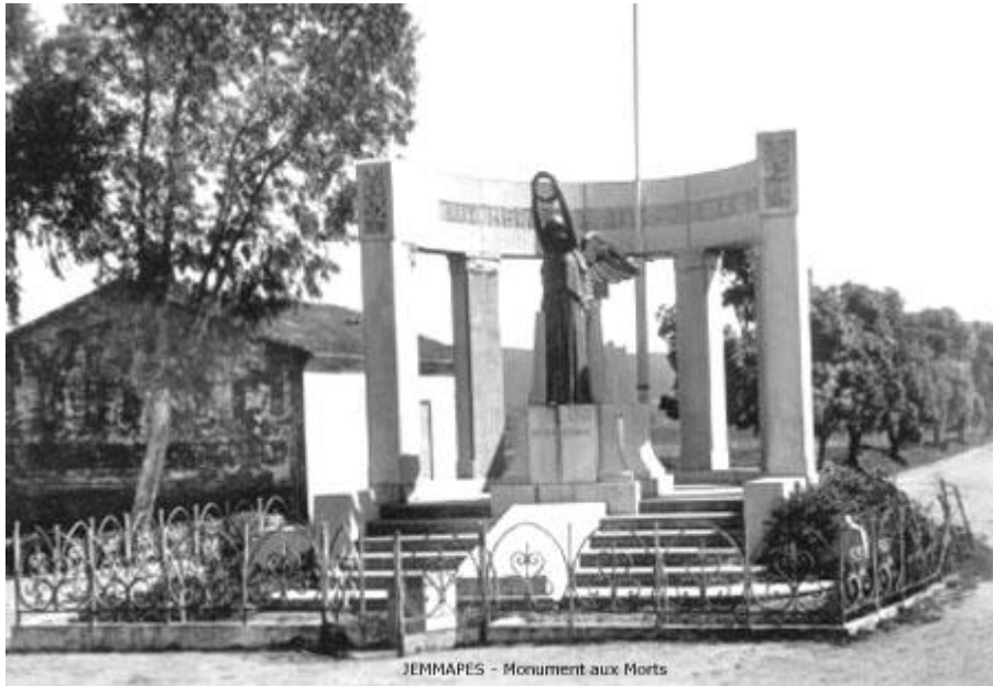
JEMMAPES - Monument aux Morts

Le relevé n°57268 mentionne les noms de 145 soldats « Morts pour la France » au titre de la Guerre 1914/1918 ; à savoir :